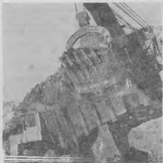
Идет погрузка руды.