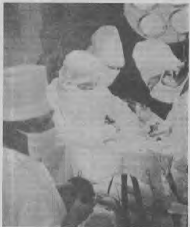
Оленегорская медсанчасть располагает операционными, отвечающими требованиям, современной хирургии. Техническая оснащенность и уровень квалификации специалистов позволяют в год делать более 600 операций различной сложности.