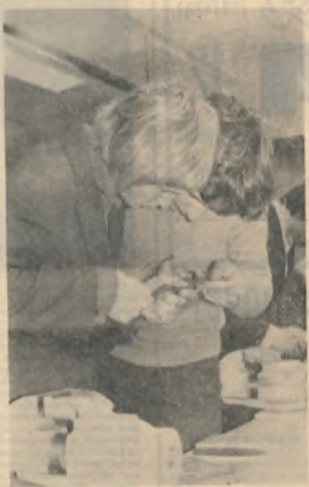
Учащиеся среднего городского профессионально-технического училища № 20 со всей серьезностью относятся к изучению своей будущей профессии. Работа с инструментами, которыми им потом придется работать, доставляет истинное удовольствие. Точность, качество изготавливаемых изделий, работу, которую им придется выполнять, требует большого внимания.

Лучшее время дня на пятикилометровой дистанции показал воспитанник детско-юношеской спортивной