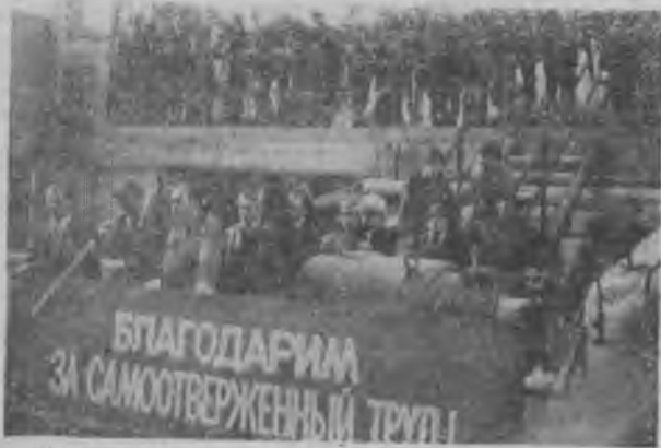
На снимке: во время митинга.