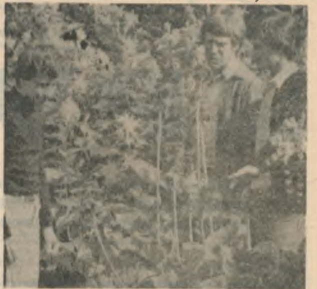
Интересную, увлекательную и познавательную экскурсию совершили 17 августа фигуристы сборной страны в города Кировск и Апатиты. Тренеры и фигуристы, находящиеся на тренировочных сборах, ознакомились с достопримечательностями городов, побывали в Полярном альпийском ботаническом саду.

Командир научно-исследовательского отряда.