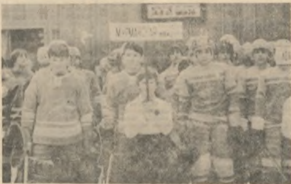
НА ПАРАДЕ КОМАНДА МУРМАНСКОЙ ОБЛАСТИ.