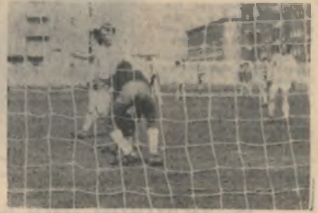
НА СНИМКЕ: момент игры.

Четыре дня в нашем городе проходили соревнования по футболу среди юношей на первенство областного совета ДСО «Труд». В первый день оленегорский «Горняк» встретился с командой города Канда-