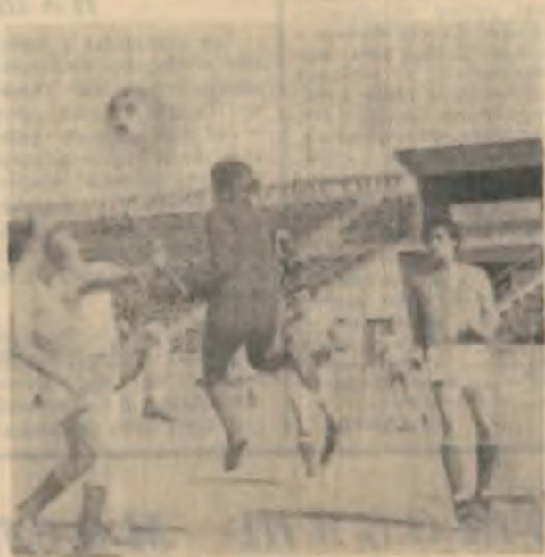
На снимке: встреча цеховых команд.