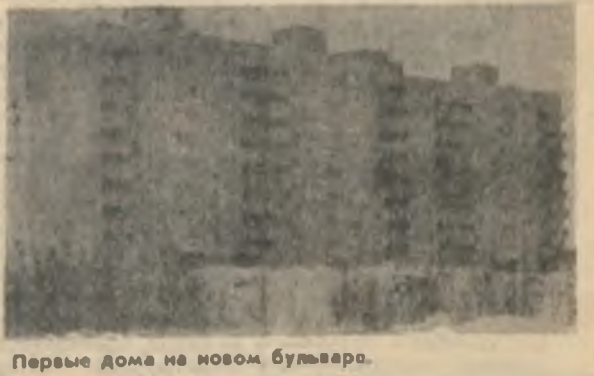
Первые дома на новом бульваре.