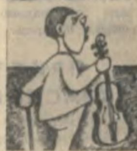
— У других дедушки и бабушки нормальные, а у меня — туристы.