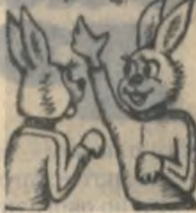
— Смотрите, эти тоже начинают бегать трусцой.