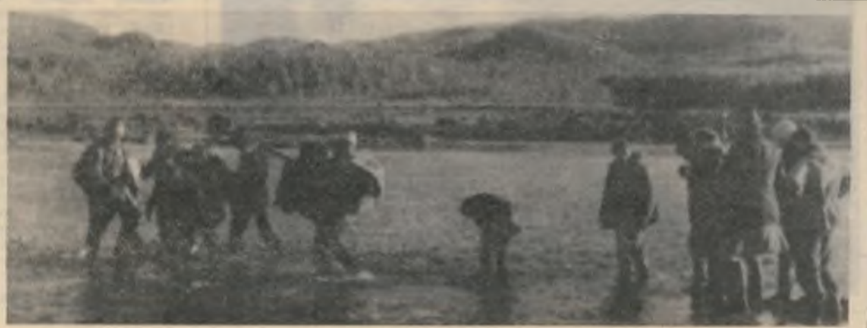
Фото токаря РМЦ Владимира КОЛУПАЕВА.