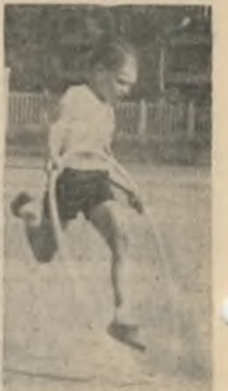
На снимках: фрагменты праздника «День советской семьи».