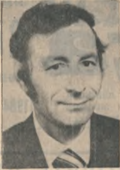
Они работают экскаваторщиками, оба возглавляют бригады.

Для поощрения цехов — победителей, достигших наивысших показателей в смотре, устанавливаются премии: для цехов первой группы — 500 рублей, для цехов второй группы — 400 рублей.