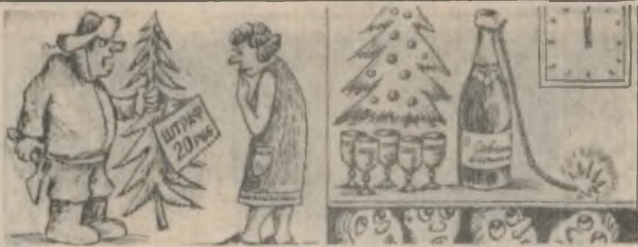
Легко обязательно из леса хотелось... Без слов. Рис. В. ЛЕВОВА.