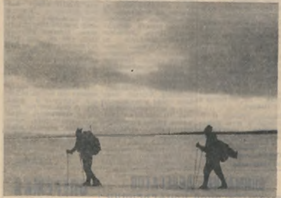
НА РЫБАЛКУ В ВЫХОДНОЙ ДЕНЬ

Основной состав «Горняка» на своем поле принимал команду «Энергетик» из Полярных Зорь — чемпиона прошлого года. Гости победили с результатом 5:3. Это второе поражение «Горняка» в нынешнем сезоне, второе в двух играх.