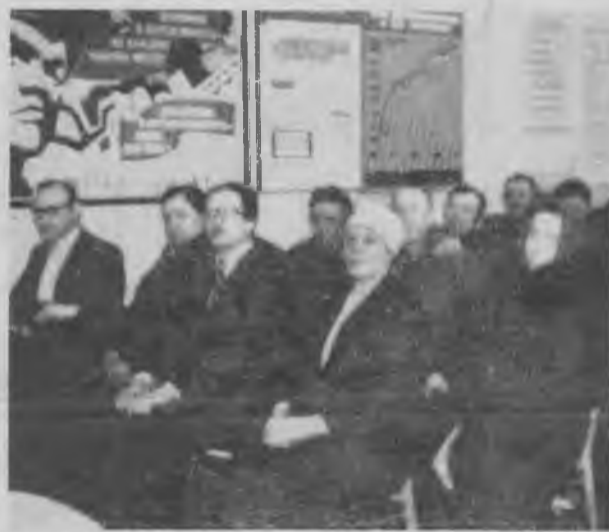
РАБОТАЕМ В НОВЫХ УСЛОВИЯХ