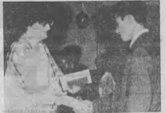
● Фото В. Гаврилицы.

Цех технологического транспорта является крупной технологической еди-