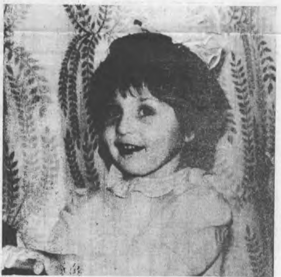
● МНЕ ШЕСТЬ ЛЕТ.

Итак, магазин № 7 ждет своих покупателей. Режим работы магазина: с 10.00 до 19.00 ежедневно, перерыв на обед с 14.00 до 15.00, выходной — воскресенье.