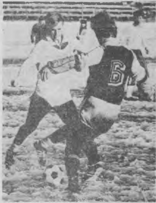
Еще не стал снег и на поле — жаркая схватка