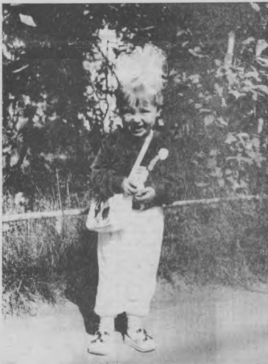
● Как хорошо летом у бабушки...