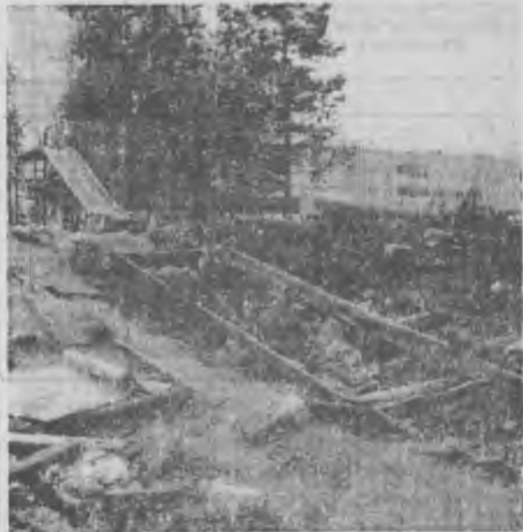
© ВО ДВОРЕ ДОМА № 3 ПО УЛ. МОЛОДЕЖНЫЙ БУЛЬВАР