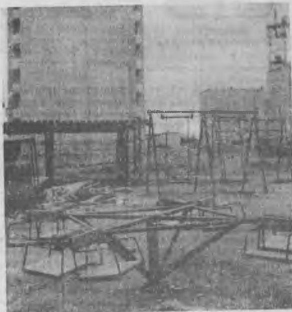
© ВО ДВОРЕ ДОМА № 7. ПО УЛ. КАПИТАНА ИВАНОВА

Продолжение, начало в № 49 от 26 июня, № 57 от 3 июля.