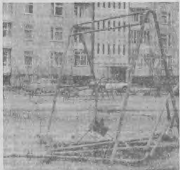
© ВО ДВОРЕ ДОМА № 9 ПО УЛ. ЮЖНАЯ