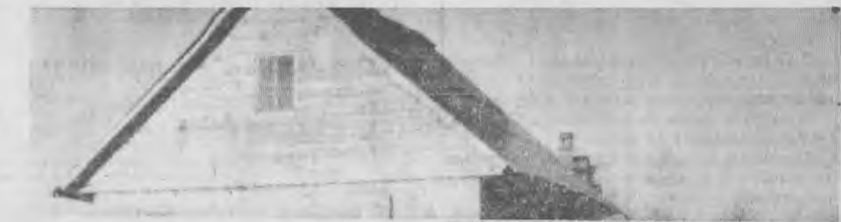
В МНОГОЭТАЖНОЙ КОРОБКЕ, ГОСТИНИЦЕ, ОБЩЕЖИТИИ, В ДАЧНОМ ПОСЕЛКЕ ИЛИ В ДЕРЕВНЕ