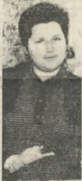
— Мы просто рискнули. Хотя скажу, что риск видится незначительным: в стране всеобщий хаос, дилерализация цен. Естественно,

люди больше думают о том, как накормить себя, нежели, как лучше выглядеть. Цены на продукты высокие, и каждый старается выкроить из бюджета на лишний кусок хлеба, чем на стрижку. Все это понятно. Но согласитесь, женщина всегда остается женщиной, и желание хорошо выглядеть сильнее всего.