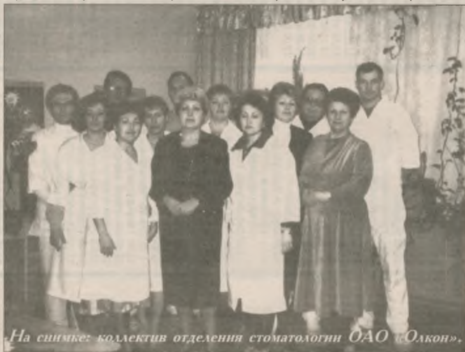
На снимке: коллектив отделения стоматологии ОАО «Олкон».

канские «Терминаторы» для стерилизации наконечников — в городе этого нет нигде, да и в области «Терминатор» есть не у каждого, поскольку цена очень высока и далеко не все могут позволить себе такое приобретение.