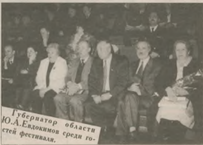
Губернатор области Ю.А.Евдокимов среди гостей фестиваля.

надежды эти не оправдались, и до сих пор там идет война. Я знаю, дорогие друзья, что вы собираетесь здесь, в этом зале, объединенные одной главной задачей — поддержать друг