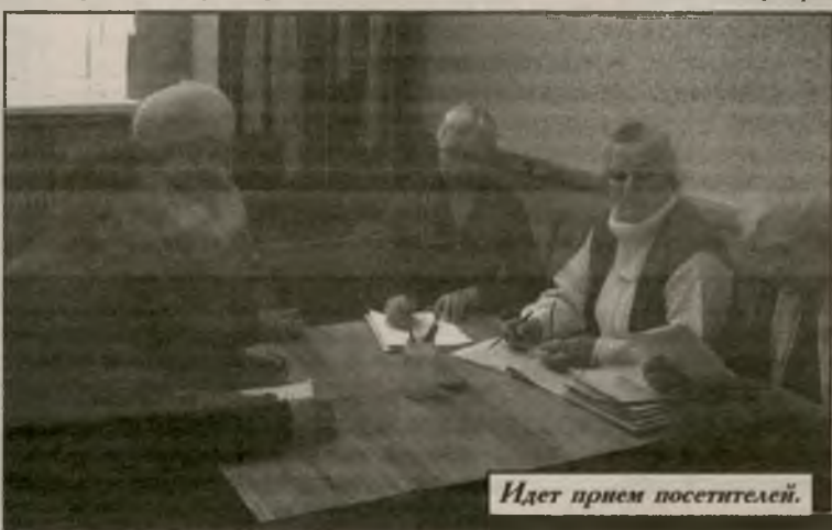
Идет прием посетителей.