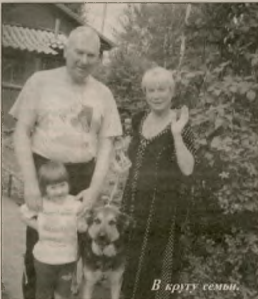
В кругу семьи.

дых специалистов для конкретных предприятий города. Работа с молодежью — важная составляющая работы с кадрами, что в свою очередь приведет к росту производительности труда;