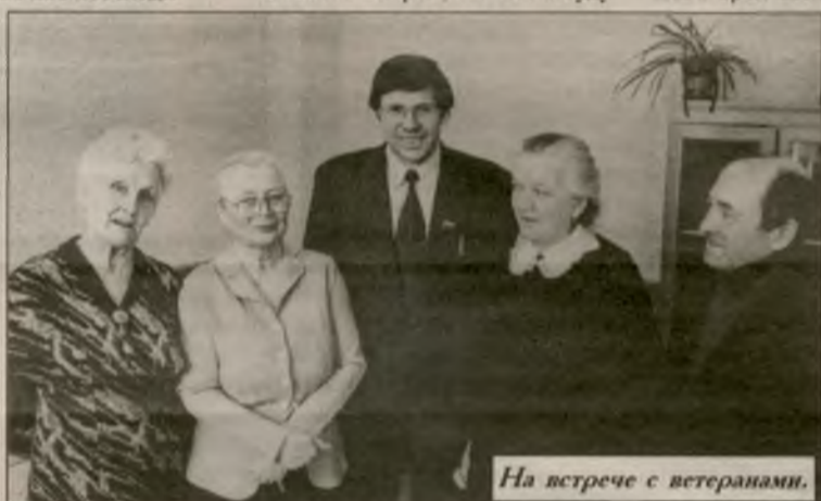
На встрече с ветеранами.