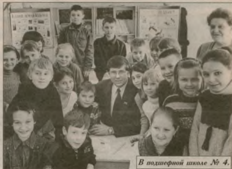
В подшефной школе № 4.

Материал оплачен из избирательного фонда кандидата на должность главы муниципального образования Н.Л.Сердюка.