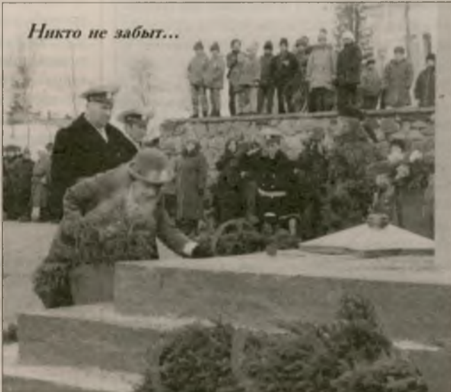
Никто не забыт...