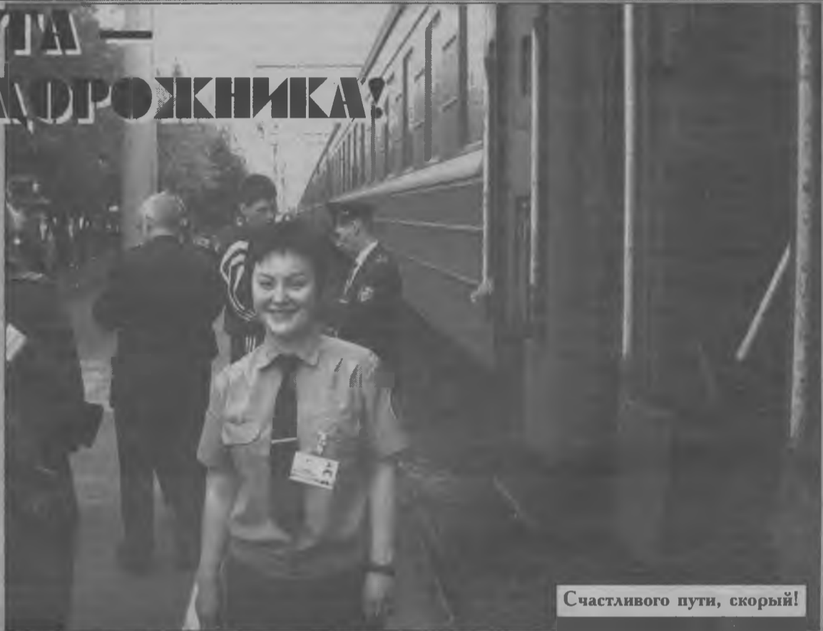
Счастливого пути, скорый!