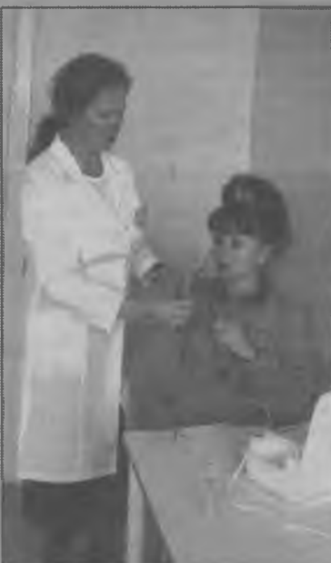
Ингалятор «Бореал» — самый современный из аппаратов.

Медицинская деятельность осуществляется на основании лицензии, согласно перечню медицинских услуг: