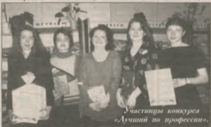
Участницы конкурса «Лучший по профессии».

Библиотеки по-прежнему ждут своих читателей. Центральная детская библиотека (Ленинградский, 7) сообщает, что выставки творческих работ Е. Шагалиной и учащих детской художественной школы открыты для посетителей. Добро пожаловать!