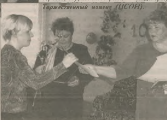
Торжественный момент (ЦСОН).