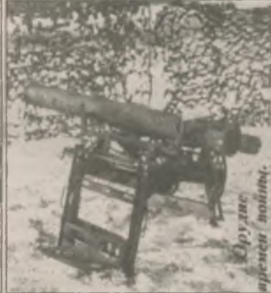
Оружие времен войны.