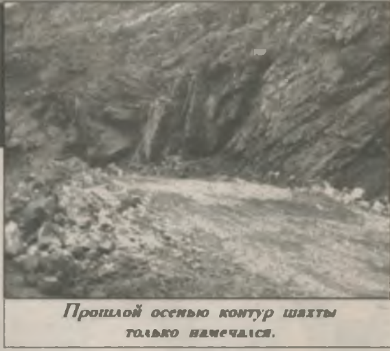
Прошлой осенью контур шахты только намечался.

Между тем, открытые работы по добыче руды из карьера идут своим чередом. Все недоразумения, возникавшие, пока не были согласованы режимами горняков и подземщиков, по большому счету, устранены — остальные проблемы решаются по ходу дела. Все понимают: медлить со строительством подземки нельзя, но и тормозить из-за нее остальное производство в планы комбината не входит. Работа должна вестись слаженно. Так она, собствен-