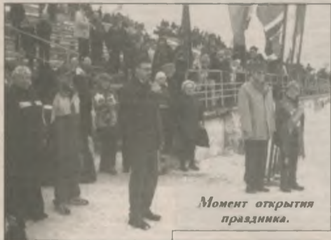
Момент открытия праздника.