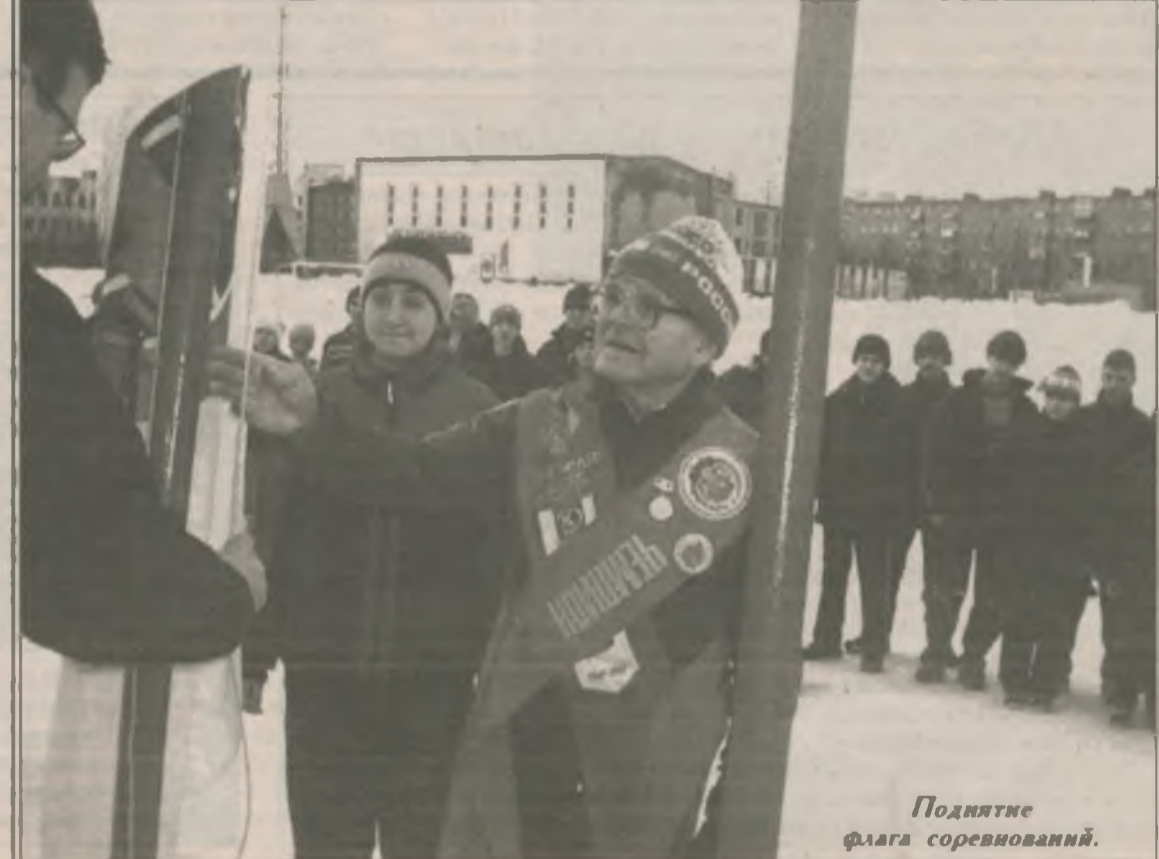
Поднятие флага соревнований.

В минувшие выходные в рамках юбилейного Праздника Севера состоялись соревнования по конькобежному спорту. Подробности читайте на 3-й стр.