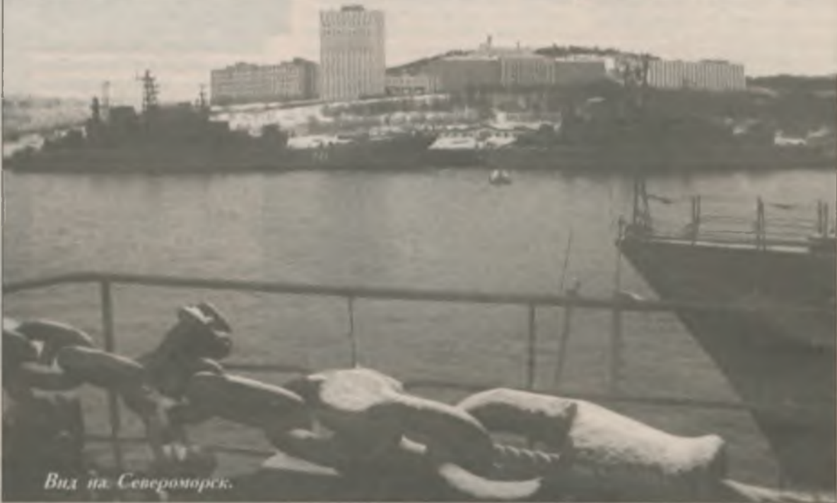
Вид на Североморск.