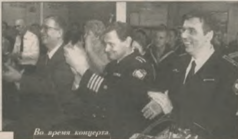
Во время концерта

бы — мы знаем, что довольно одобрительно о корабле, о вас как о коллективе, отзываются командование Краснознаменного Северного флота. Что касается участников и сегодняшнего мероприятия, и всех предыдущих, то кроме благодарности в их адрес, нужно еще сказать о том, что наши великолепные артисты, действительно, способны совершить чудо, что они и делают постоянно, своими выступлениями дарят радость и хорошее настроение, принося в служебные будни ощущение праздника.