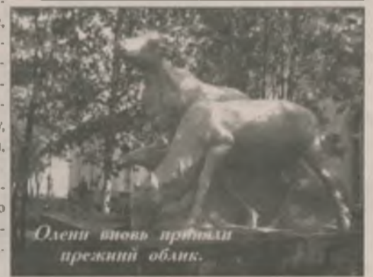
Олени вновь приняли прежний облик.

★ Если вы, отправляясь в путь, оказались в затруднительной ситуации, не впадайте в крайности. От вас в этом случае требуются корректность, сдержанность, способность трезво мыслить, спокойно обсуждать ситуацию, искать выход вместе с начальником вокзала или другим лицом, которому поручено решение подобных вопросов. Всегда легче помочь тому, кто держит себя в руках.