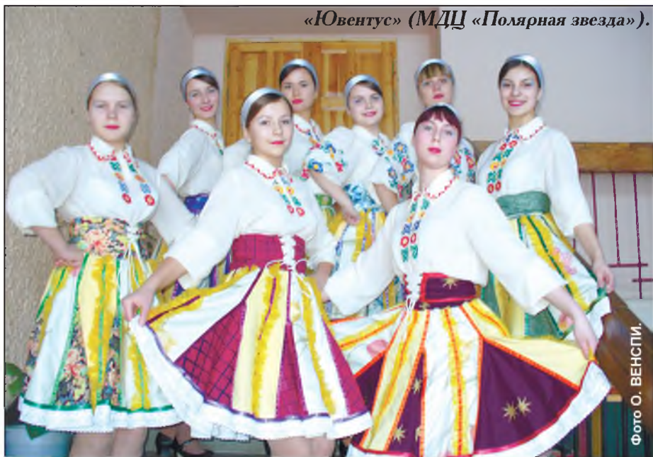
«Ювентус» (МДЦ «Полярная звезда»).