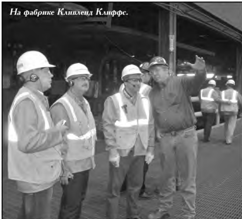
На фабрике Кливленд Клиффс.

фицированных специалистов. Особенно поразила атмосфера, в которой работают люди. Она пропитана духом солидарности, партнерства, взаимопонимания и заинтересованности в улучшении всех процессов производства, повышения эффективности и производительности. Каждый, от рабочего до директора, нацелен именно на это. Такой дух предприятия, уверен, формировался многие годы. Мне очень хотелось бы, чтобы и у нас сформировалась такая доброжелательная атмосфера, способствующая конструктивной и результативной работе.