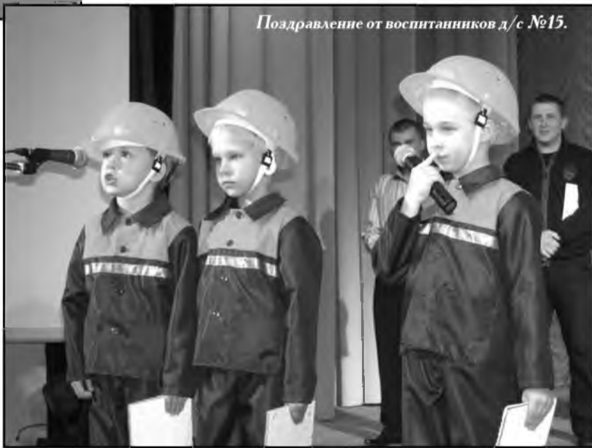
Поздравление от воспитанников д/с №15.

По завершении торжественной части начался розыгрыш спортивной лотереи, который проводила Г. Давирова. Призами в ней были также различные предметы спортивного инвентаря: мячи, дартс, теннисные и бадминтонные ракетки и другое. Затем виновников торжества ждали танцы, выступление артистов Дворца, общение с друзьями, праздничное угощение, коллек-