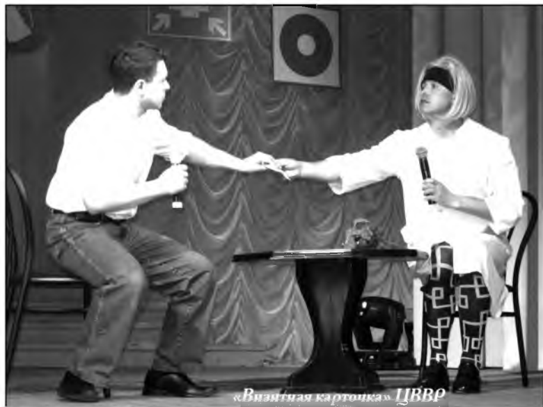
«Визитная карточка» ЦВВР

лович Швецов, автор зрелых стихотворных произведений, постоянный участник поэтического конкурса. II место досталось коллективу цеха подготовки производства и складского хозяйства, III — управлению железнодорожного транспорта.