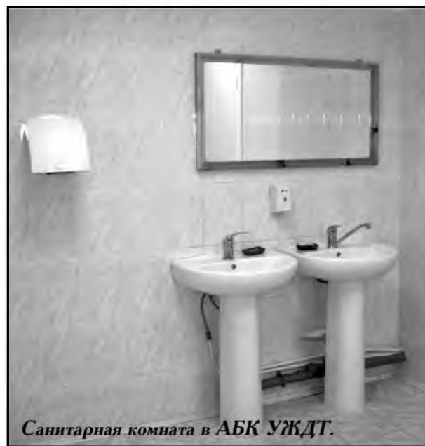
Санитарная комната в АБК УЖДТ.