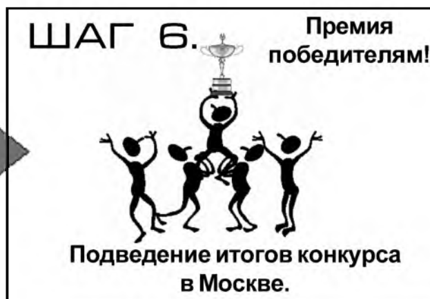
СХЕМА ПРОЦЕССА НОВАТОРСТВА

Шаг 1. Сотрудник заполняет бланк заявления на новаторское предложение (см. вкладыш).