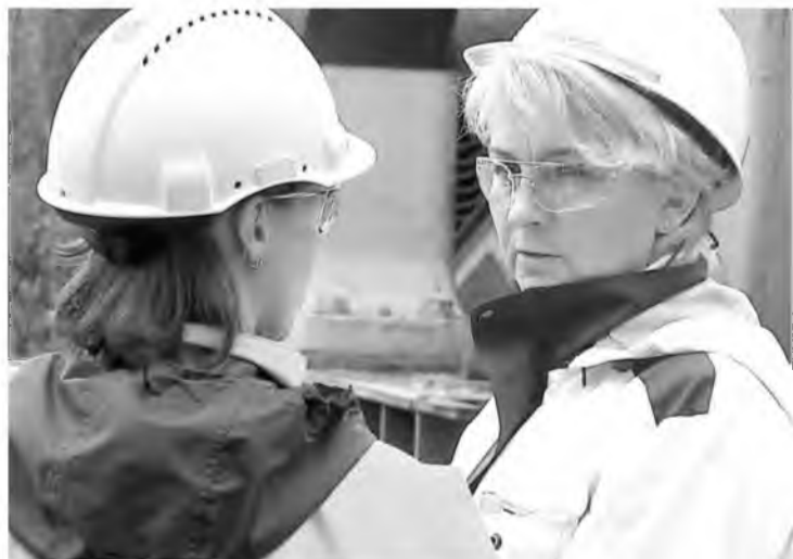
Беседы направлены на улучшение ситуации в области охраны труда на «Олконе»

На «Олконе» перезагружают методику поведенческого аудита безопасности (ПАБ). Пилотным подразделением, где внедряют изменения, стала дробильно-обогатительная фабрика комбината.