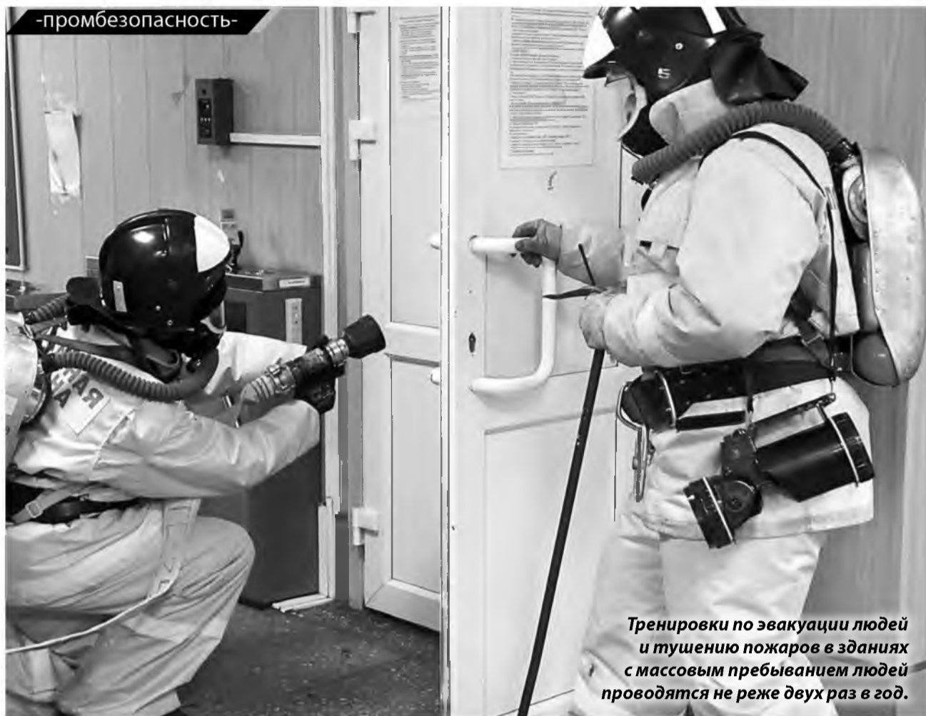
Тренировки по эвакуации людей и тушению пожаров в зданиях с массовым пребыванием людей проводятся не реже двух раз в год.