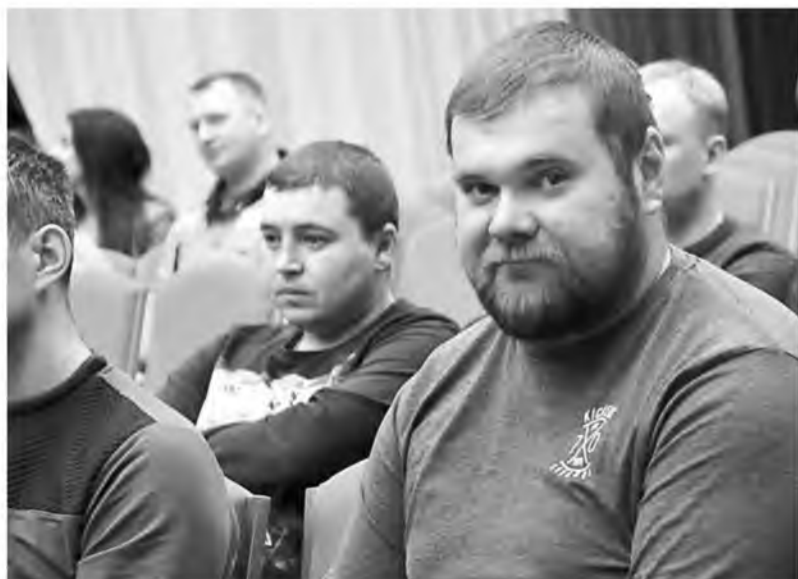
88 человек впервые устроились на комбинат за последние 11 месяцев.