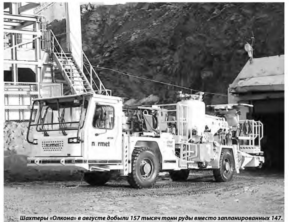
Шахтеры «Олкона» в августе добыли 157 тысяч тонн руды вместо запланированных 147.