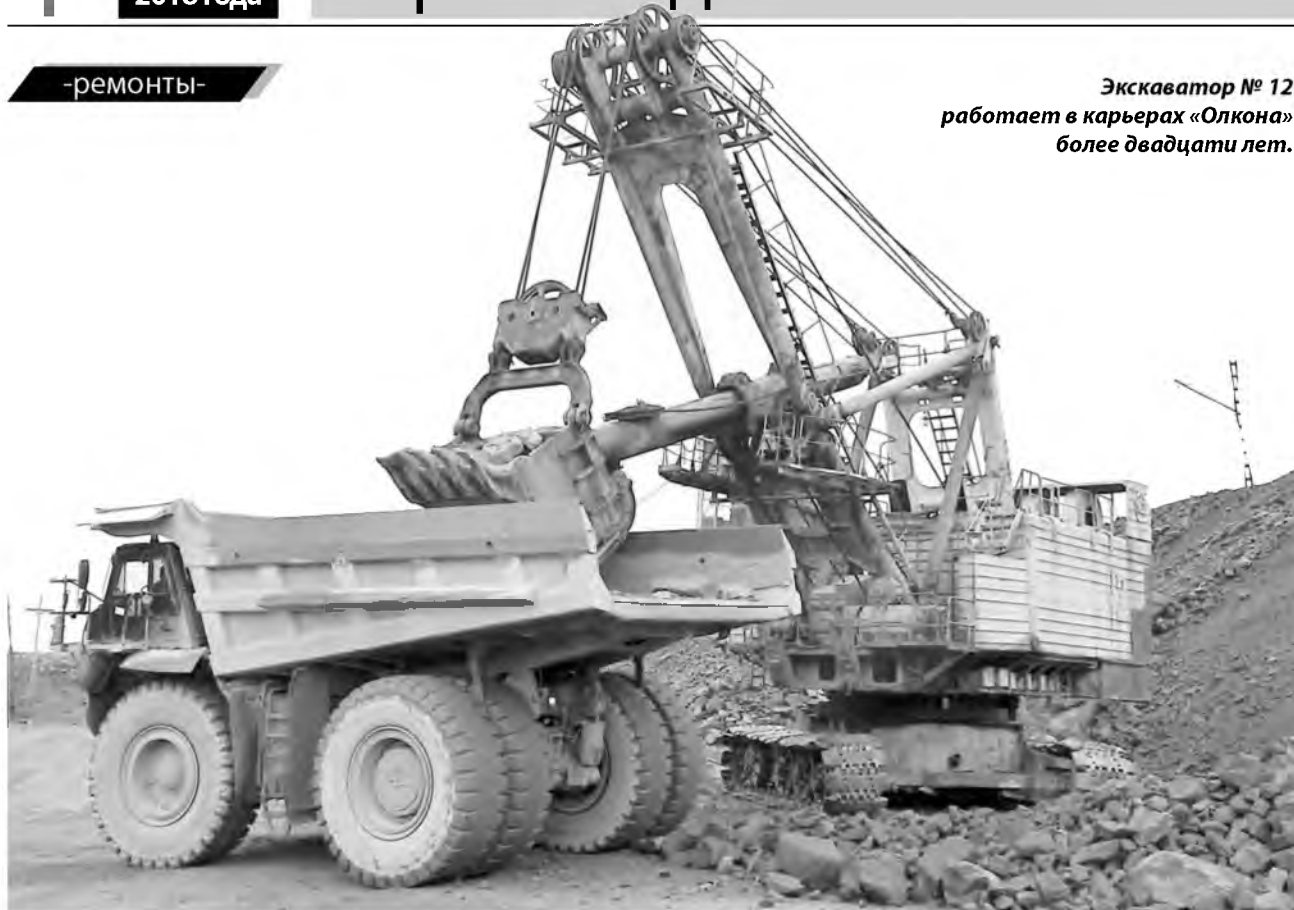
Экскаватор № 12 работает в карьерах «Олкона» более двадцати лет.