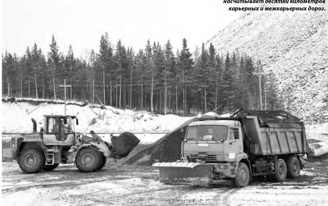
Дорожное хозяйство «Олкона» насчитывает десятки километров карьерных и межкарьерных дорог.