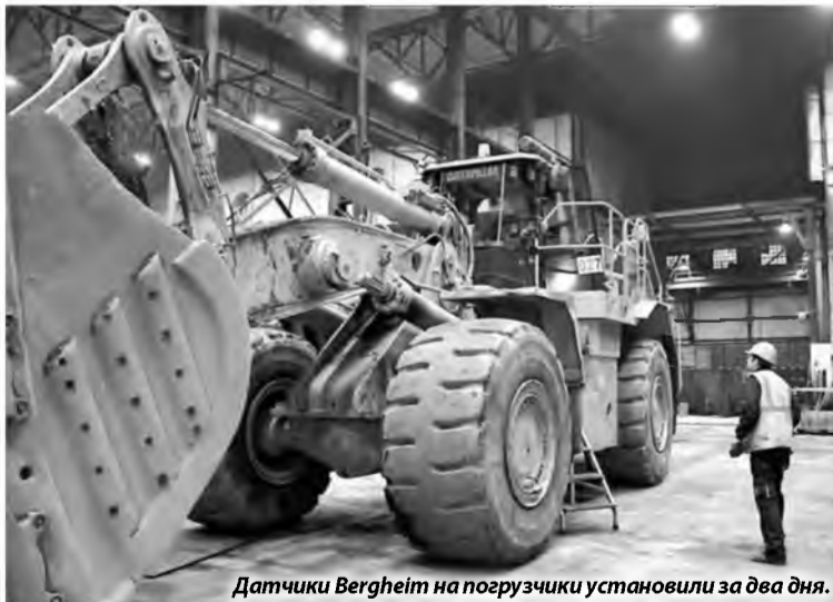
Датчики Bergheim на погрузчики установили за два дня.

Водитель погрузчика теперь контролирует вес отгружаемой продукции по сигналу датчика, который установ-