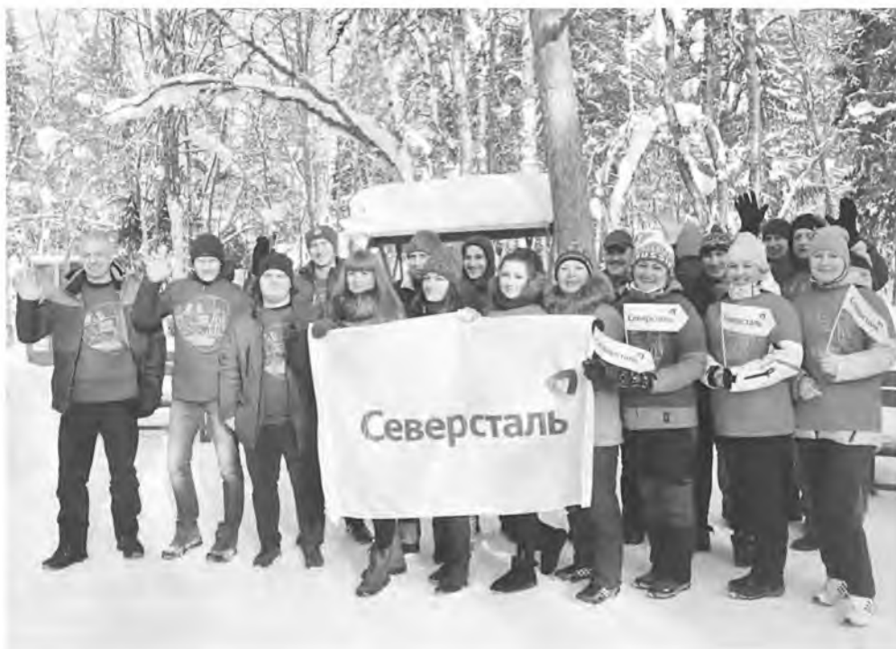
В команде «Олкона» более 20 спортсменов и болельщиков.