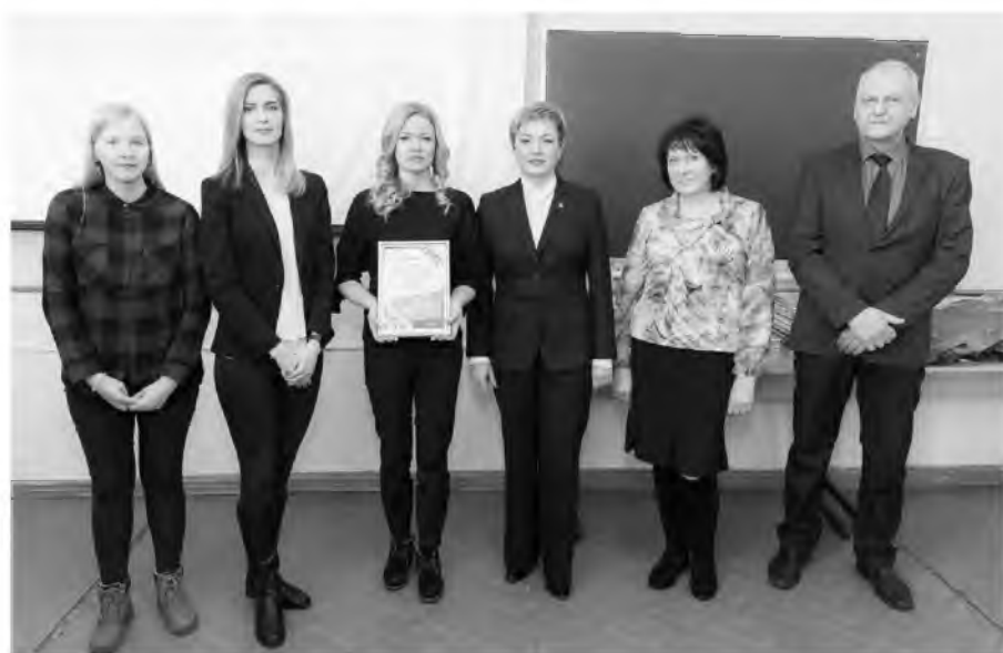
Наш корр. Фото с сайта правительства Мурманской области.

Первое место в конкурсе занял коллектив авторов, представивший проект реконструкции в Оленегорске сквера Космонавтики.