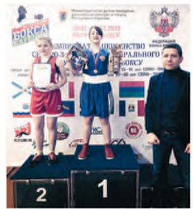
По материалам МУС «УСЦ» и МБУСШ «Олимп».