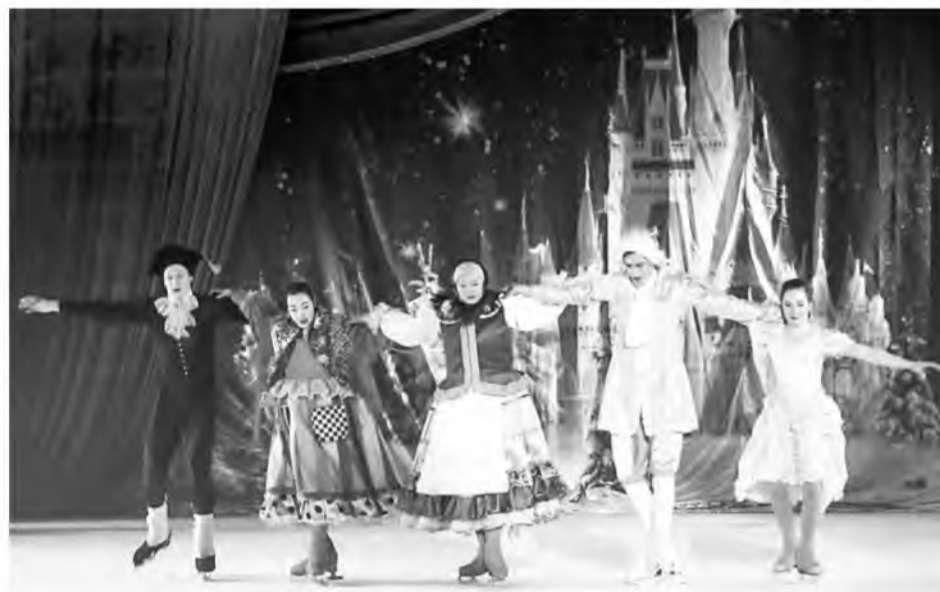
Перехватил эстафету новогодних каникул МУС «Учебно-спортивный центр» с театрализованным представлением на льду «Двенадцать месяцев».